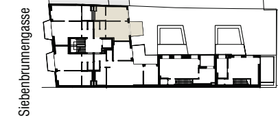
Grundriss 2. Obergeschoss