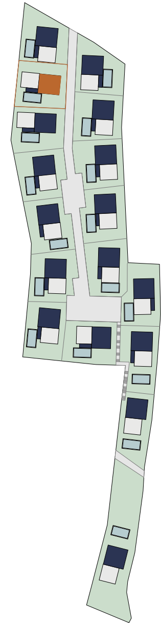
Übersicht | Lage

Bei Immobilien zu Hause. Seit 3 Generationen.