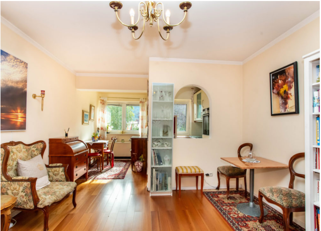
Wohn- und Esszimmer