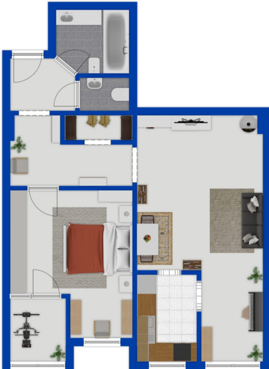
Grundriss als schematische Darstellung