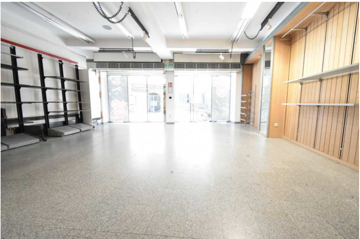
Büro-, Geschäfts oder Ausstellungsraum