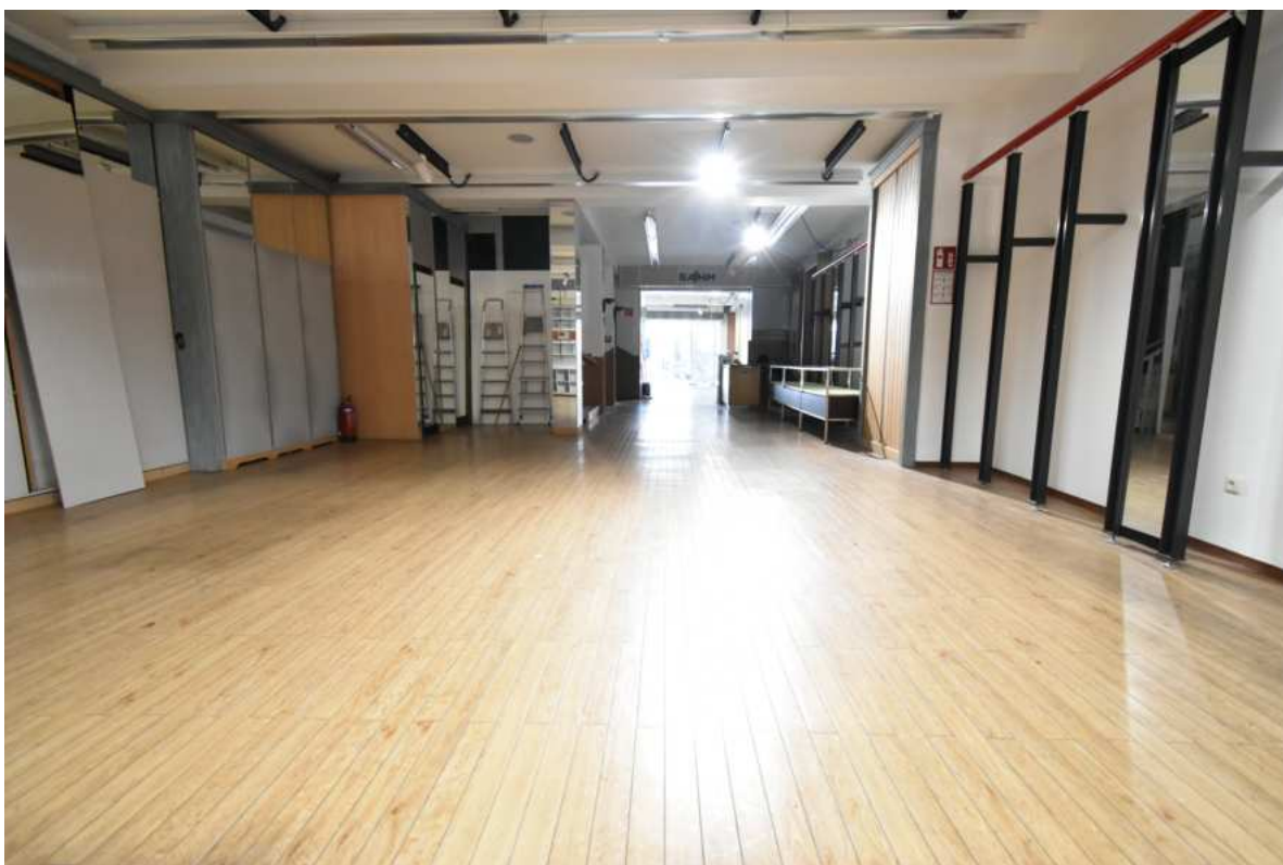
Büro-, Geschäfts oder Ausstellungsraum