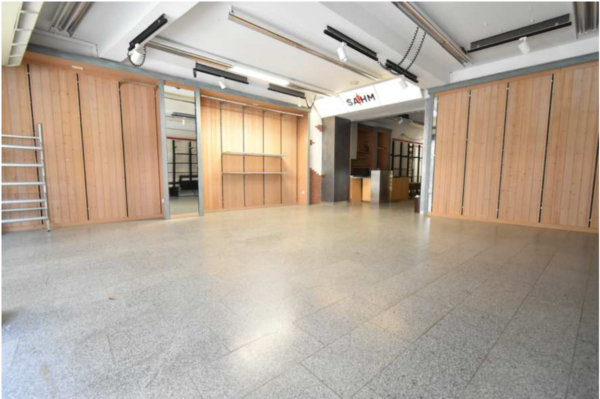
Büro-, Geschäfts oder Ausstellungsraum