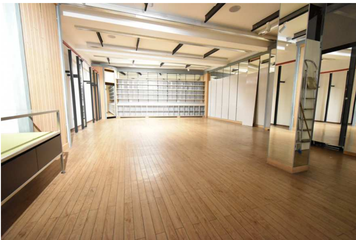
Büro-, Geschäfts oder Ausstellungsraum