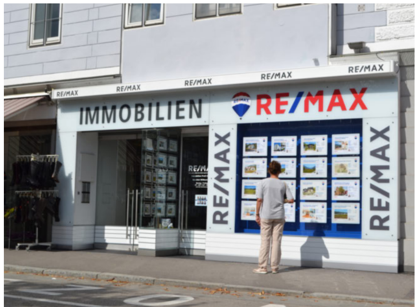
RE/MAX Bad Ischl | Esplanade 4