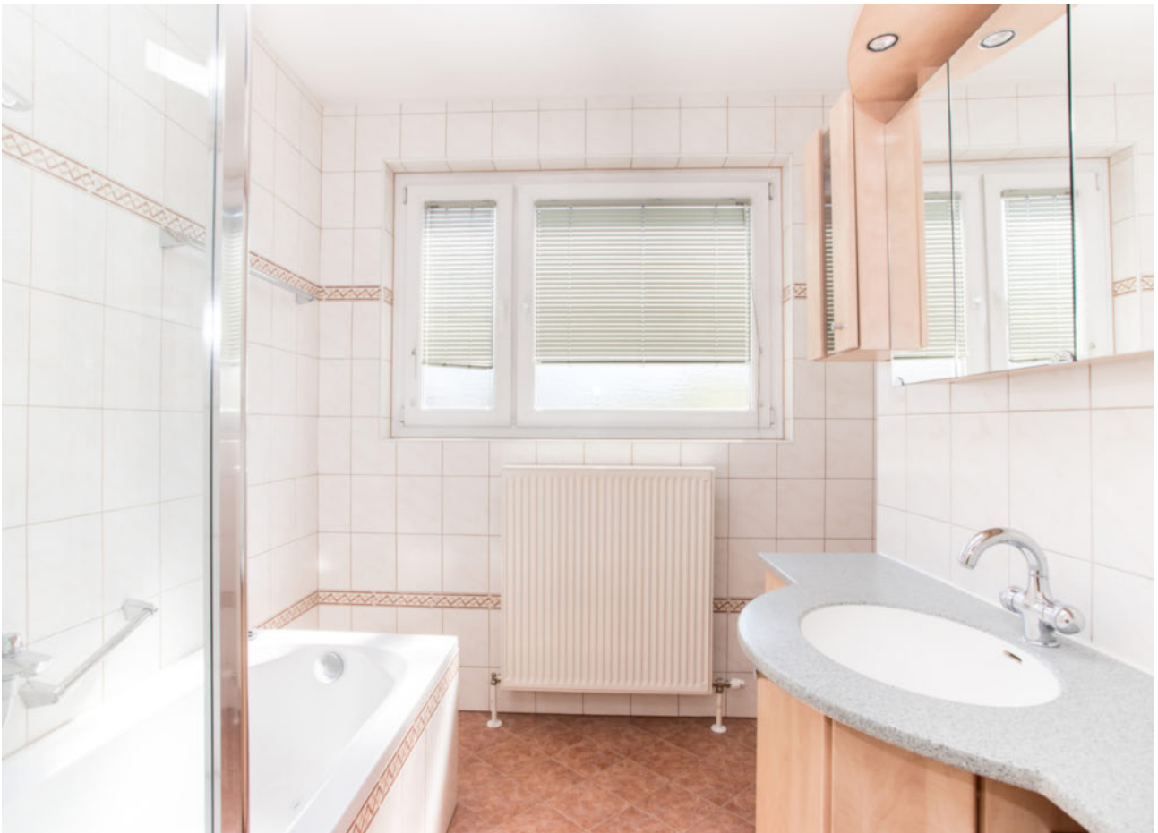
Badezimmer mit Waschmaschinenanschluss