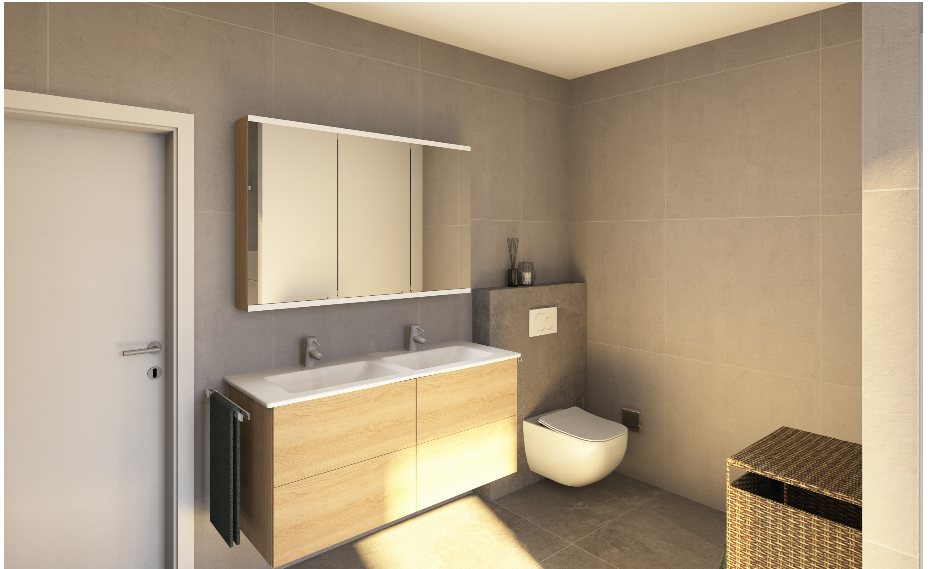
BVH Tassilo Villen Haus 2 - EG - B 11 - Variante 2 Badplanung - Sonderausstattung