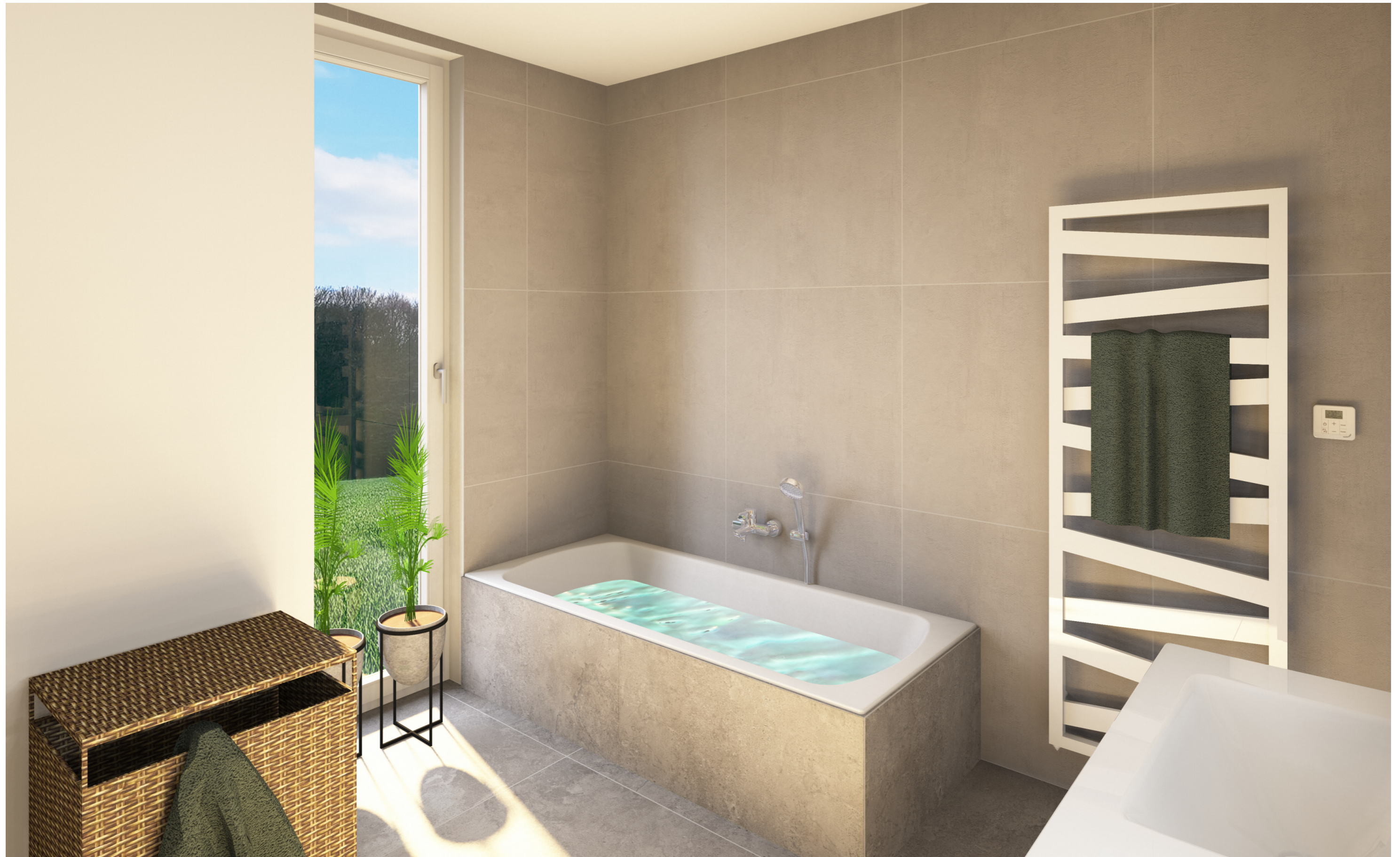
BVH Tassilo Villen Haus 2 - EG - B 11 - Variante 2 Badplanung - Sonderausstattung