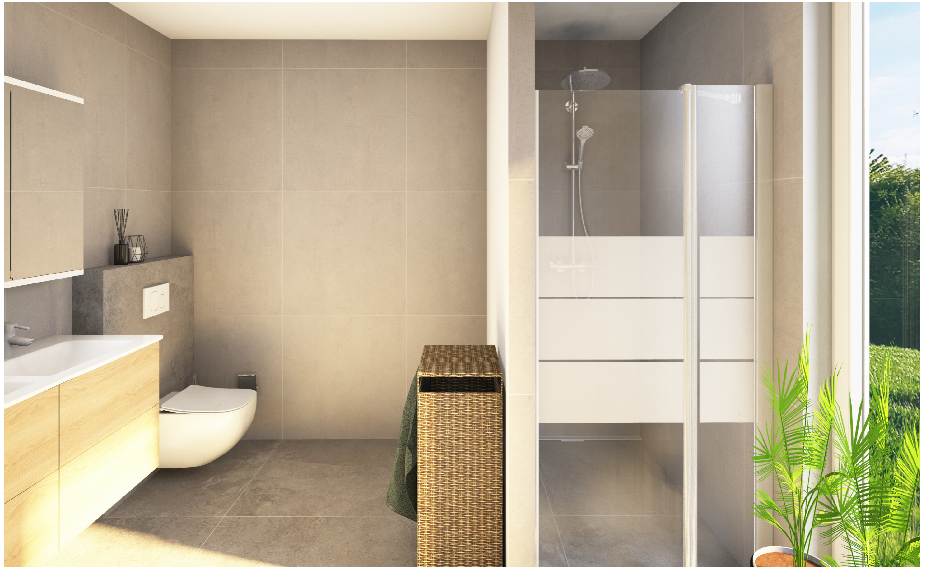
BVH Tassilo Villen Haus 2 - EG - B 11 - Variante 2 Badplanung - Sonderausstattung