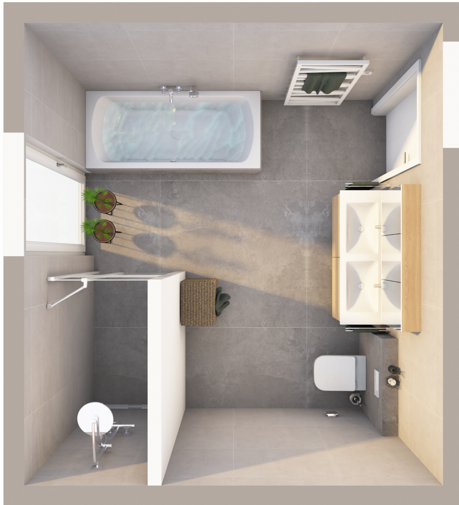
BVH Tassilo Villen Haus 2 - EG - B 11 - Variante 2 Badplanung - Sonderausstattung