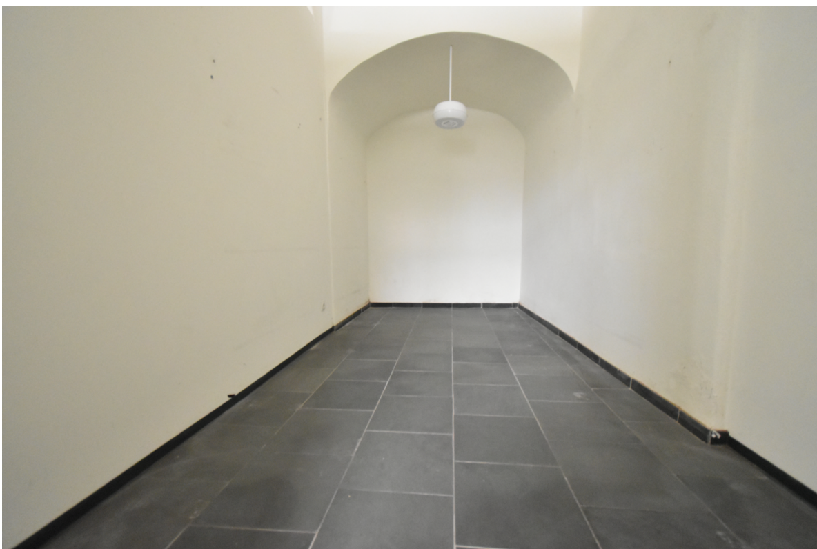
Büro-, Geschäfts oder Ausstellungsraum