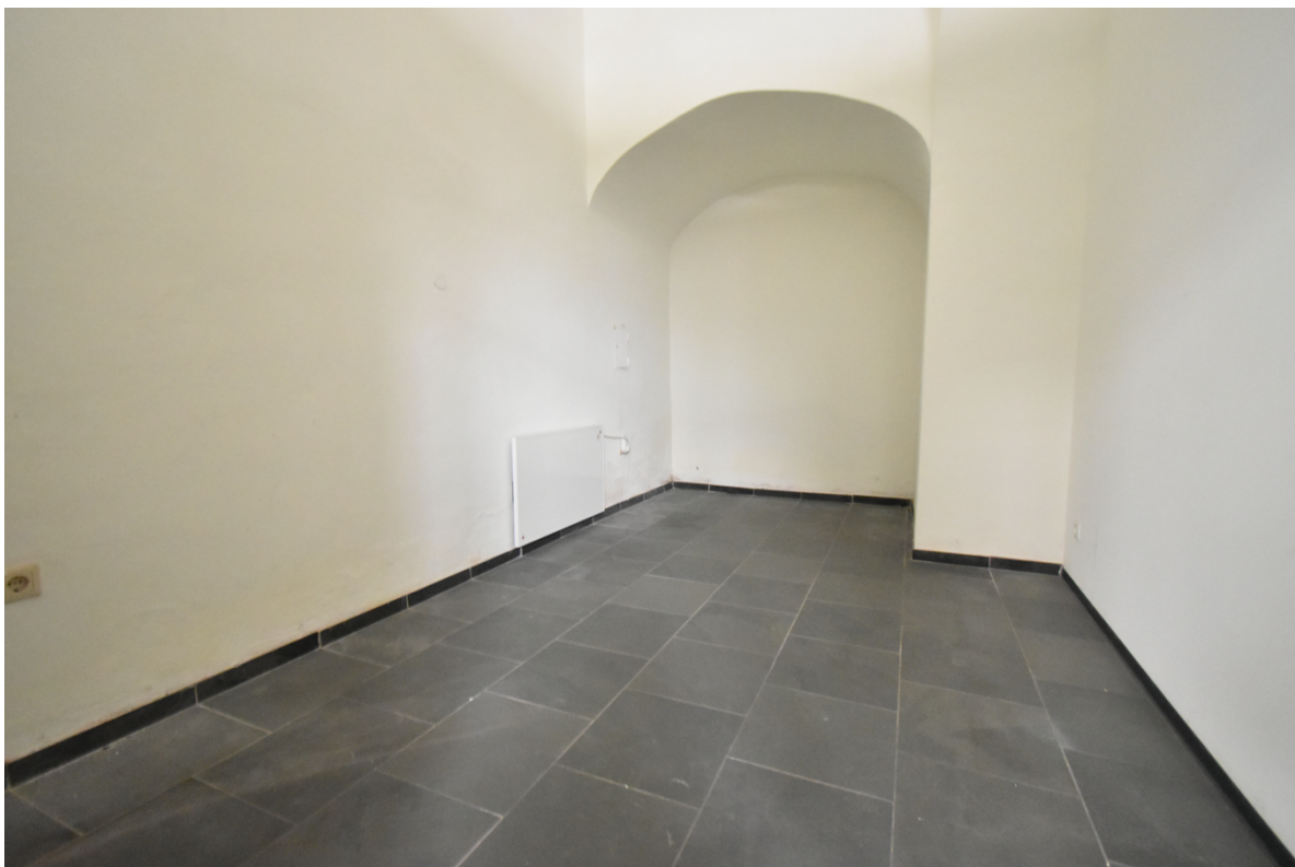
Büro-, Geschäfts oder Ausstellungsraum