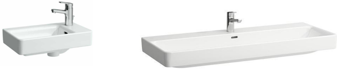
Abbildung 7: Symbolfoto – Armaturen