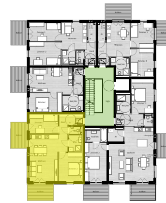
Übersicht 1. Obergeschoss