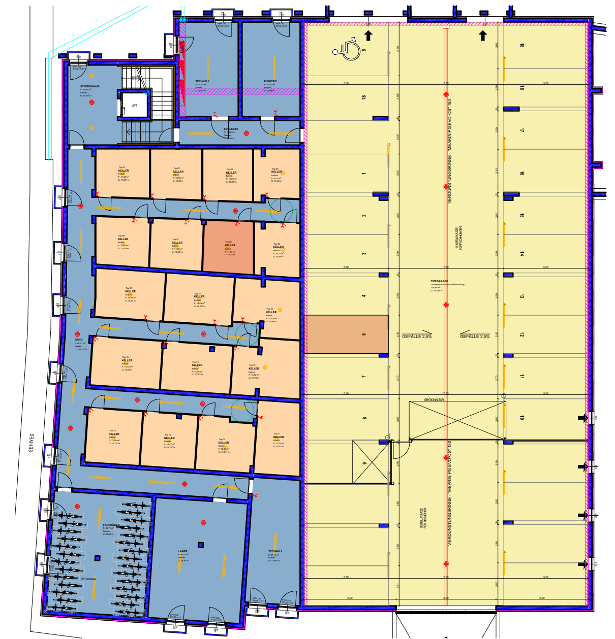
GRUNDRISS KELLERGESCHOSS / TG