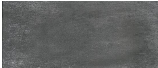
Serie Beton Antracita Matt 30x60cm