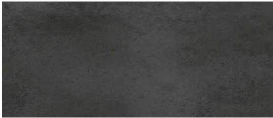
Serie Traffic Antracita 30x60cm