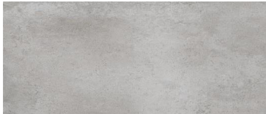
Serie Traffic Grey 30x60cm