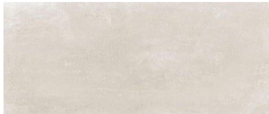
Serie Beton Beige Matt 30x60cm