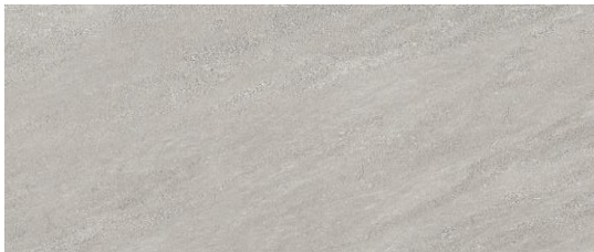
Serie Kliff Greige 30x60cm