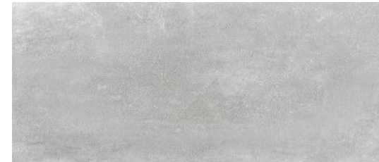
Serie Beton Grey Matt 30x60cm