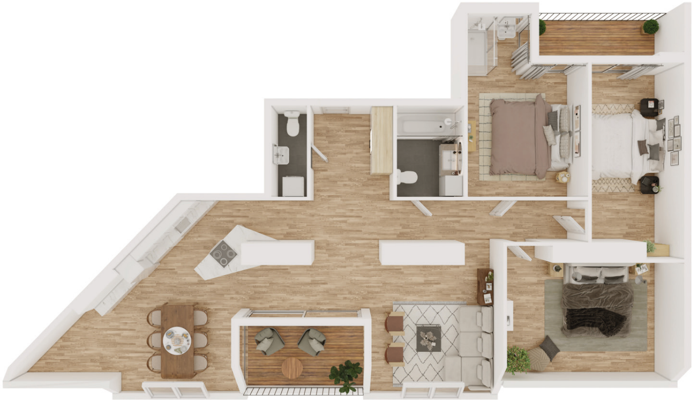
Wohnbeispiel bei 2 Wohneinheiten im DG2 mit 111 m 2 und 120 m 2 Wohnfläche