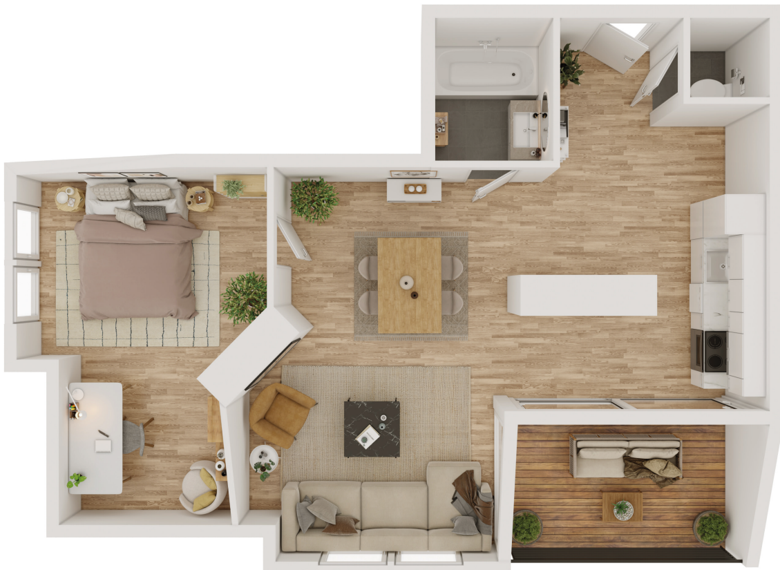
Wohnbeispiel bei 3 Wohneinheiten im DG 2 mit 69-85 m 2 Wohnfläche