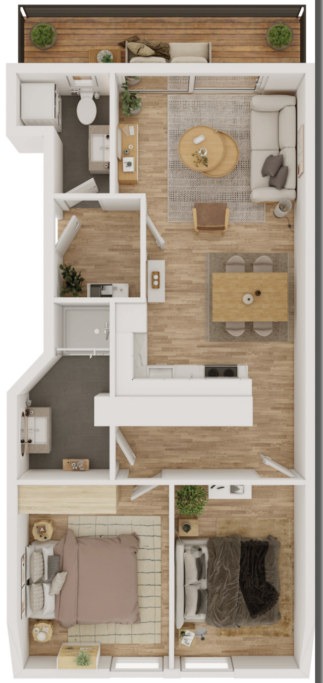
Wohnbeispiel einer Wohneinheit mit 62 m 2 Wohnfläche im DG 1