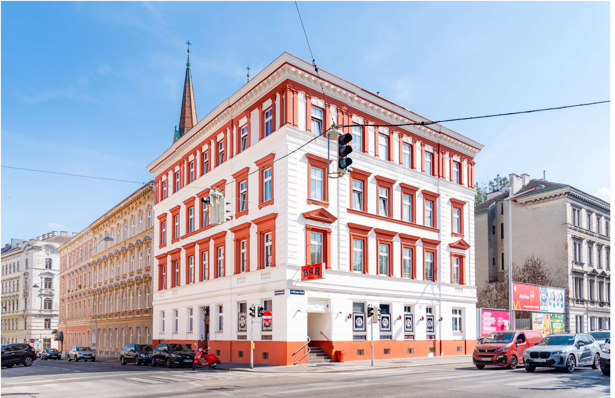
VERTRAULICH! PULVERTURMGASSE 21, OBJEKTNUMMER 1608/12296, STAND: SEPTEMBER 2024