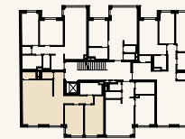
Lage im Stockwerk