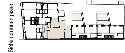
Grundriss 1. Obergeschoss