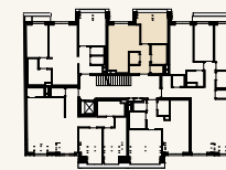
Lage im Stockwerk