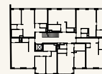
Lage im Stockwerk