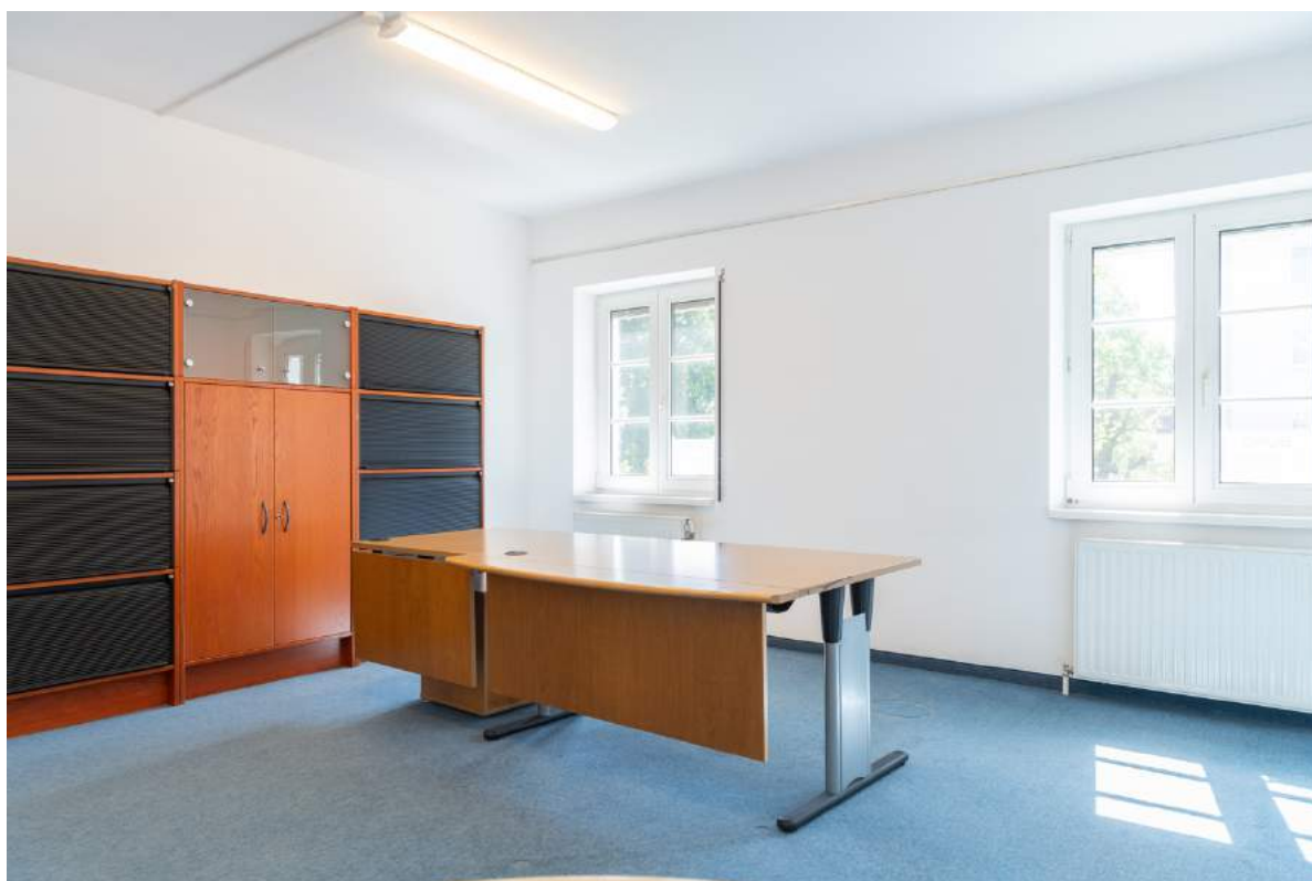
Bürraum 2 (1.OG)