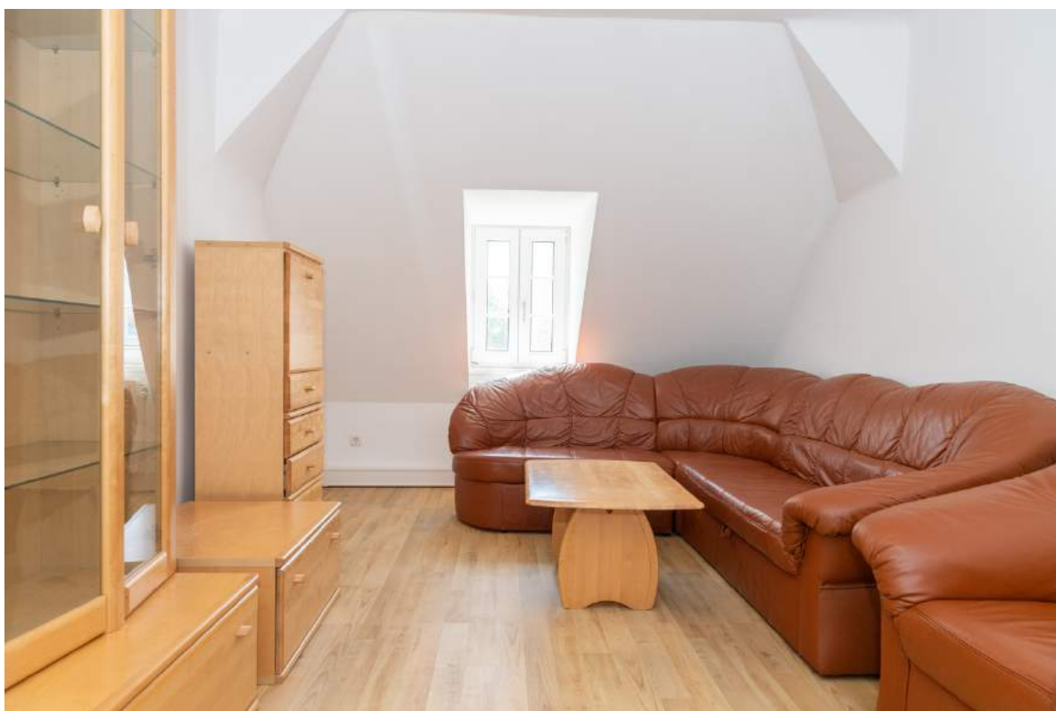
Büroraum 6 (DG)