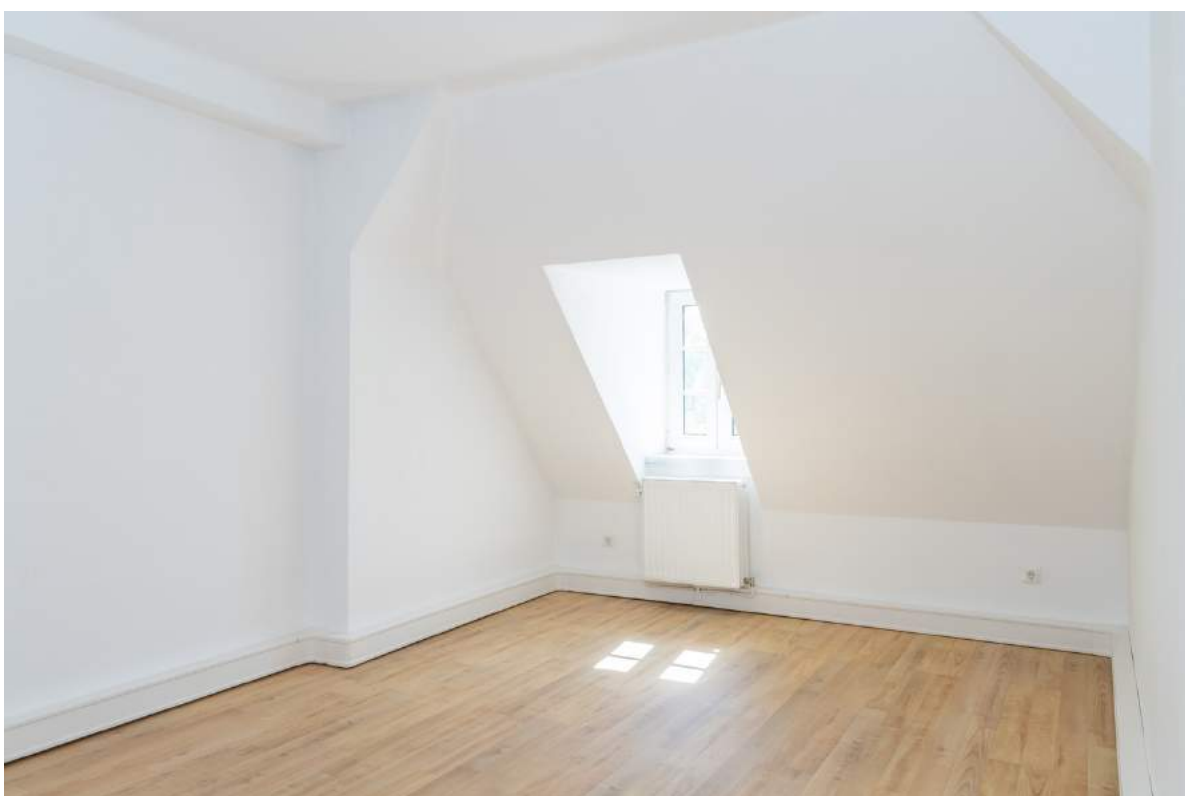
Büroraum 5 (DG)