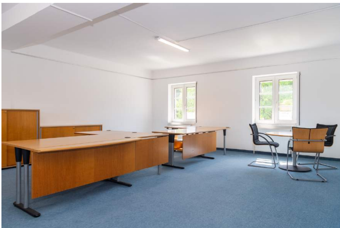
Büroraum 1 (1.OG)