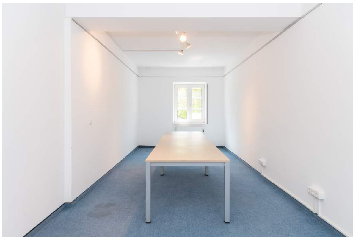
Bürraum 3 (1.OG)