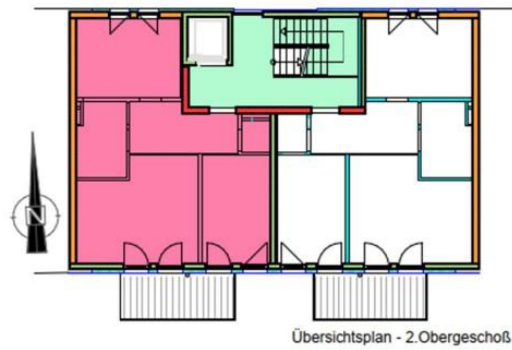
Übersichtsplan - 2.Obergeschoß