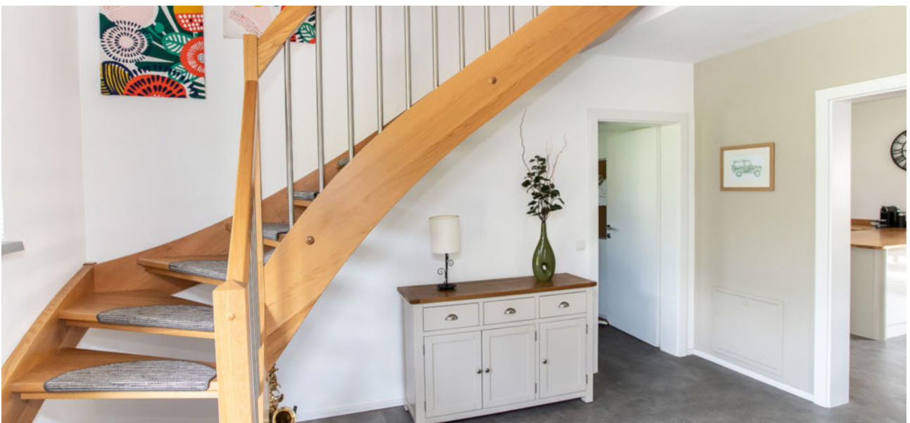
Stiegenaufgang ins OG