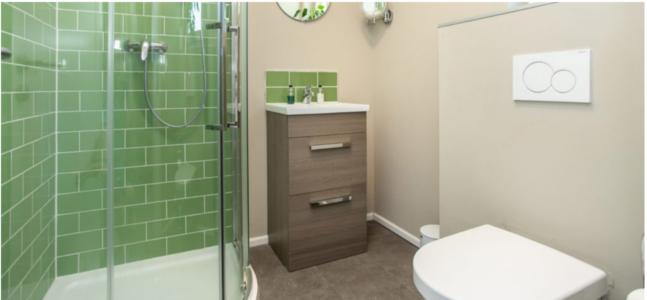
Badezimmer im EG