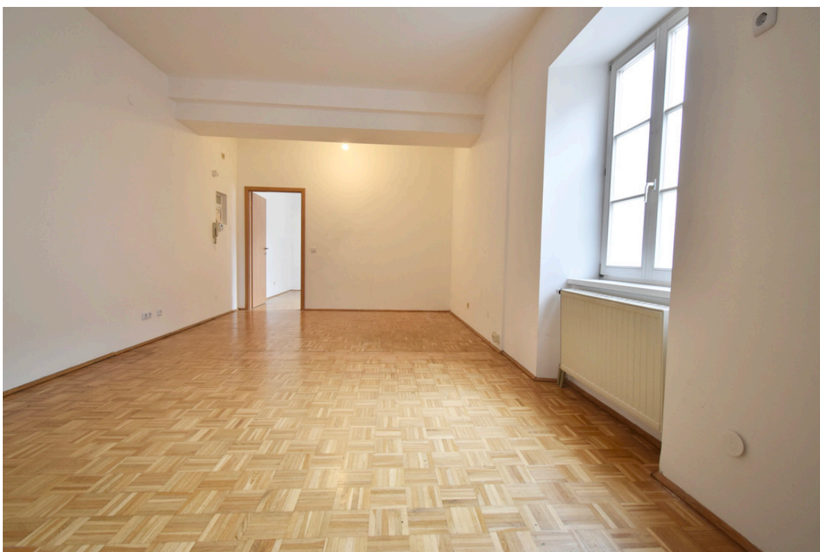
Wohn -und Essbereich mit Blick zum Schlafzimmer