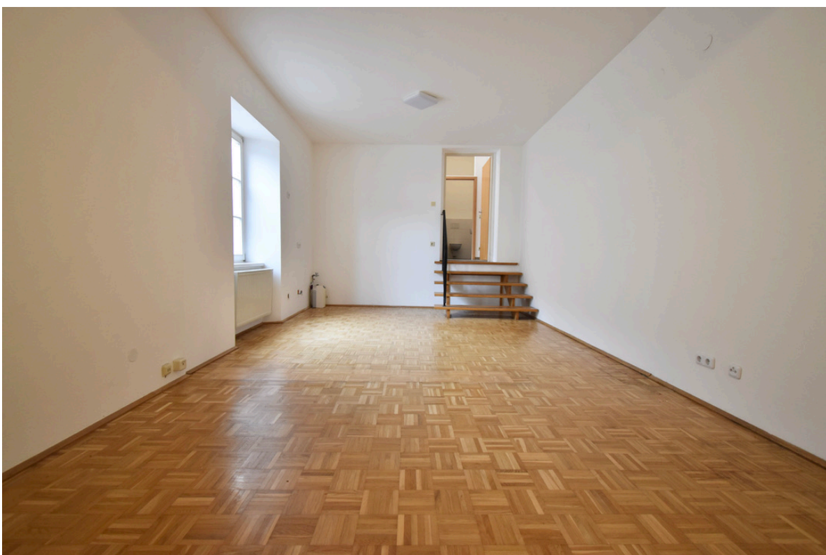
Wohn- und Essbereich mit Ausgang zum Vorzimmer/Badezimmer/WC