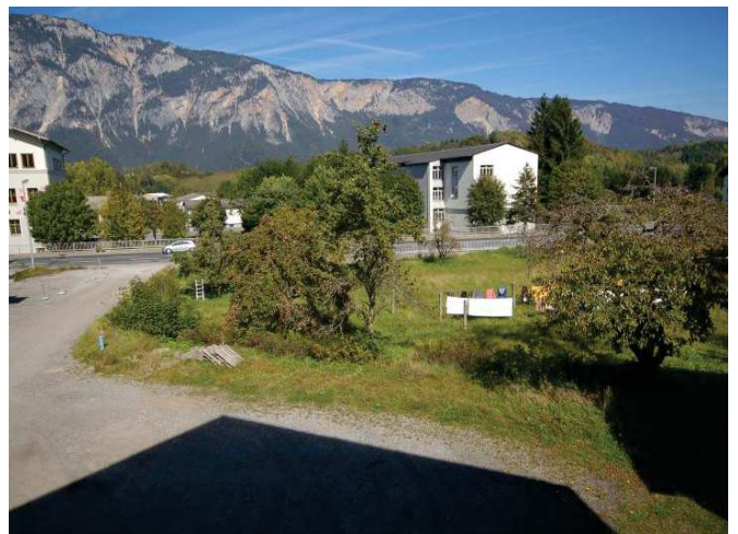
Blick nach Norden