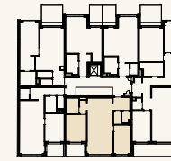
Lage im Stockwerk