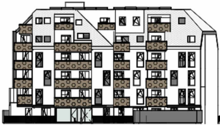
ANSICHT SÜD GARTEN SCHROTTENSTEINGASSE 6