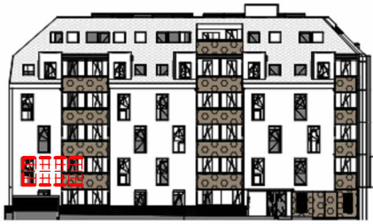
ANSICHT NORD STRASSE SCHROTTENSTEINGASSE 6