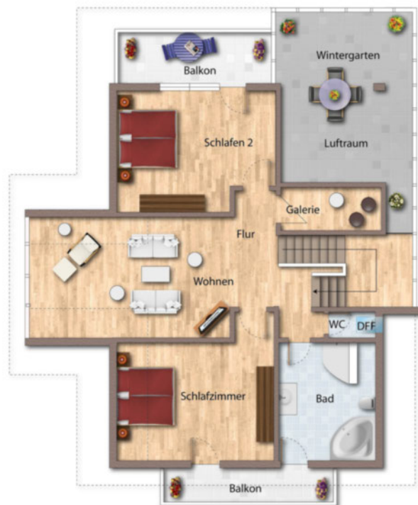
OG Grundriss als schematische Darstellung