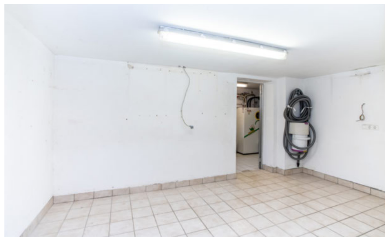
Einer der Keller/Lagerräume