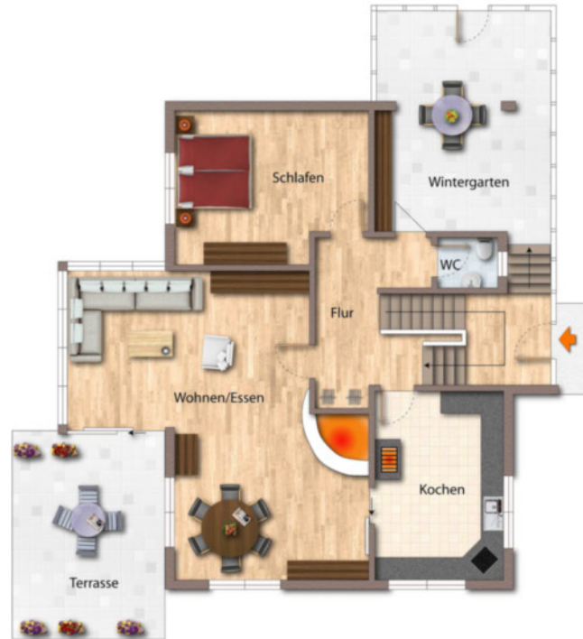
EG Grundriss als schematische Darstellung