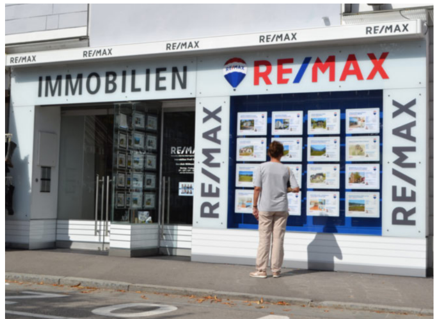
Ihr Immobilien-Kompetenz-Zentrum im Salzkammergut