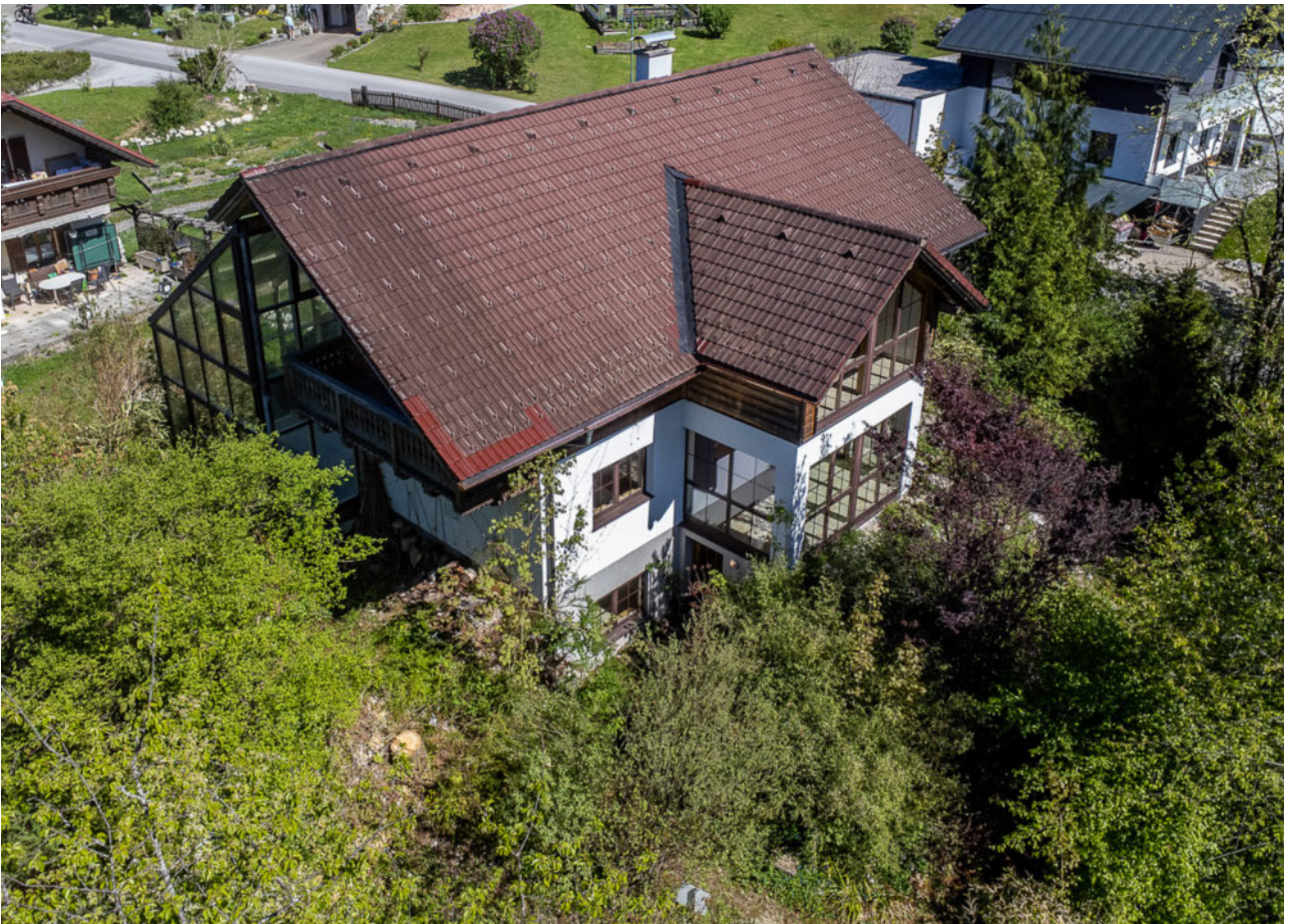
Blick von oben