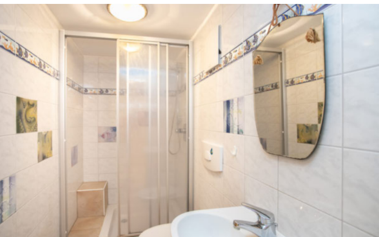
Badezimmer mit Dusche und WC im KG