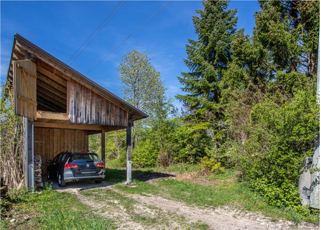
Carport und Holzlagerfläche