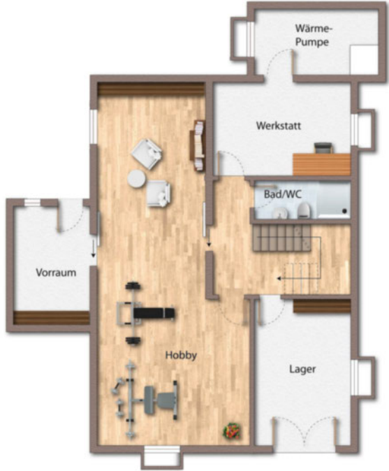
KG Grundriss als schematische Darstellung