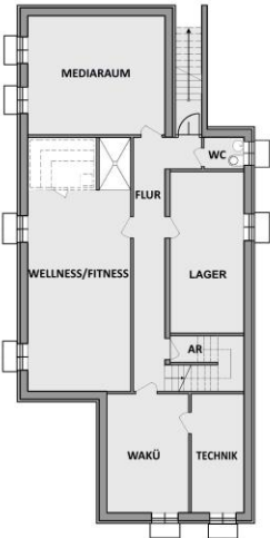
PLANSKIZZE OHNE GEWÄHR