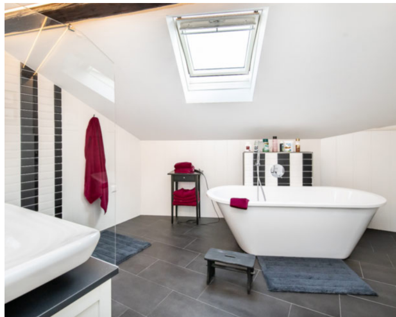
Badezimmer mit freistehender Wanne und Dachfenster