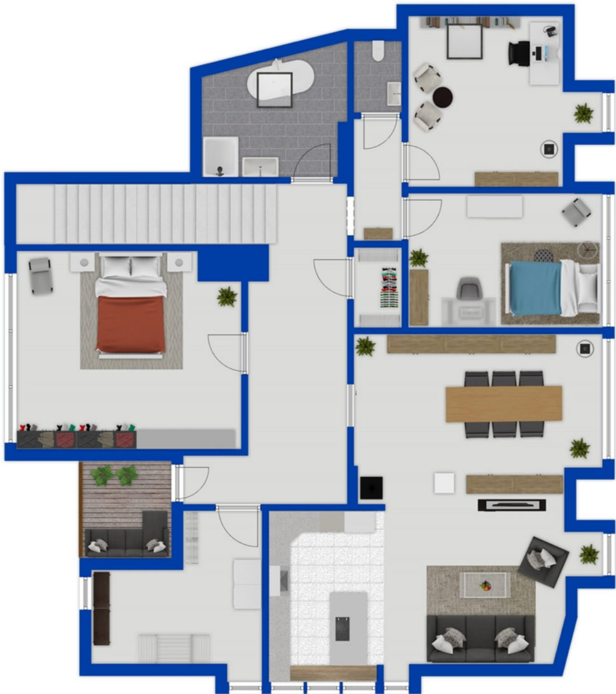
Grundriss als schematische Darstellung