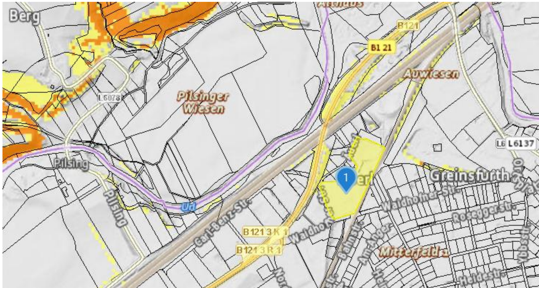
Gefahrenhinweiskarte: Waidhofnerstraße 42, 3300 Amstetten