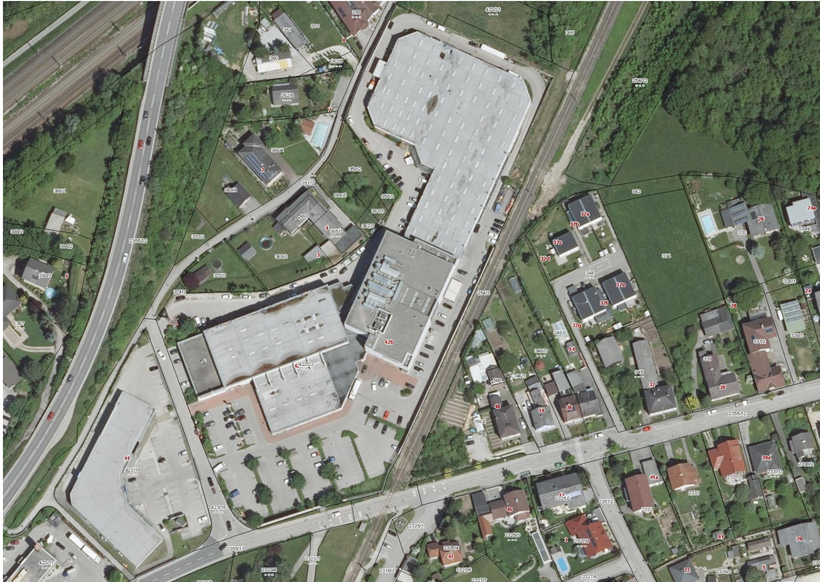
Luftbild: Waidhofnerstraße 42, 3300 Amstetten