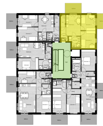
Übersicht 3. Obergeschoss