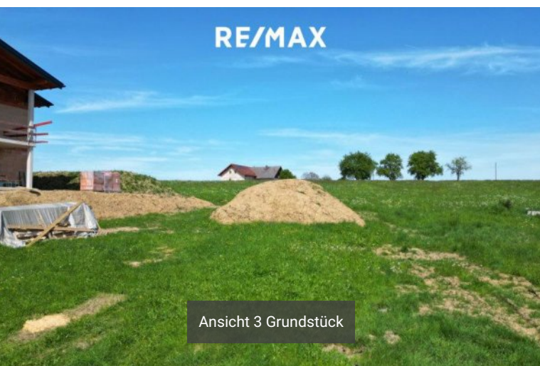
Ansicht 3 Grundstück