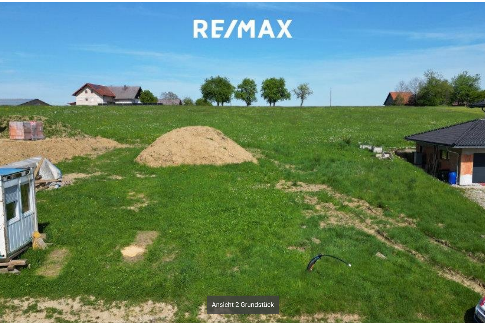
Ansicht 2 Grundstück