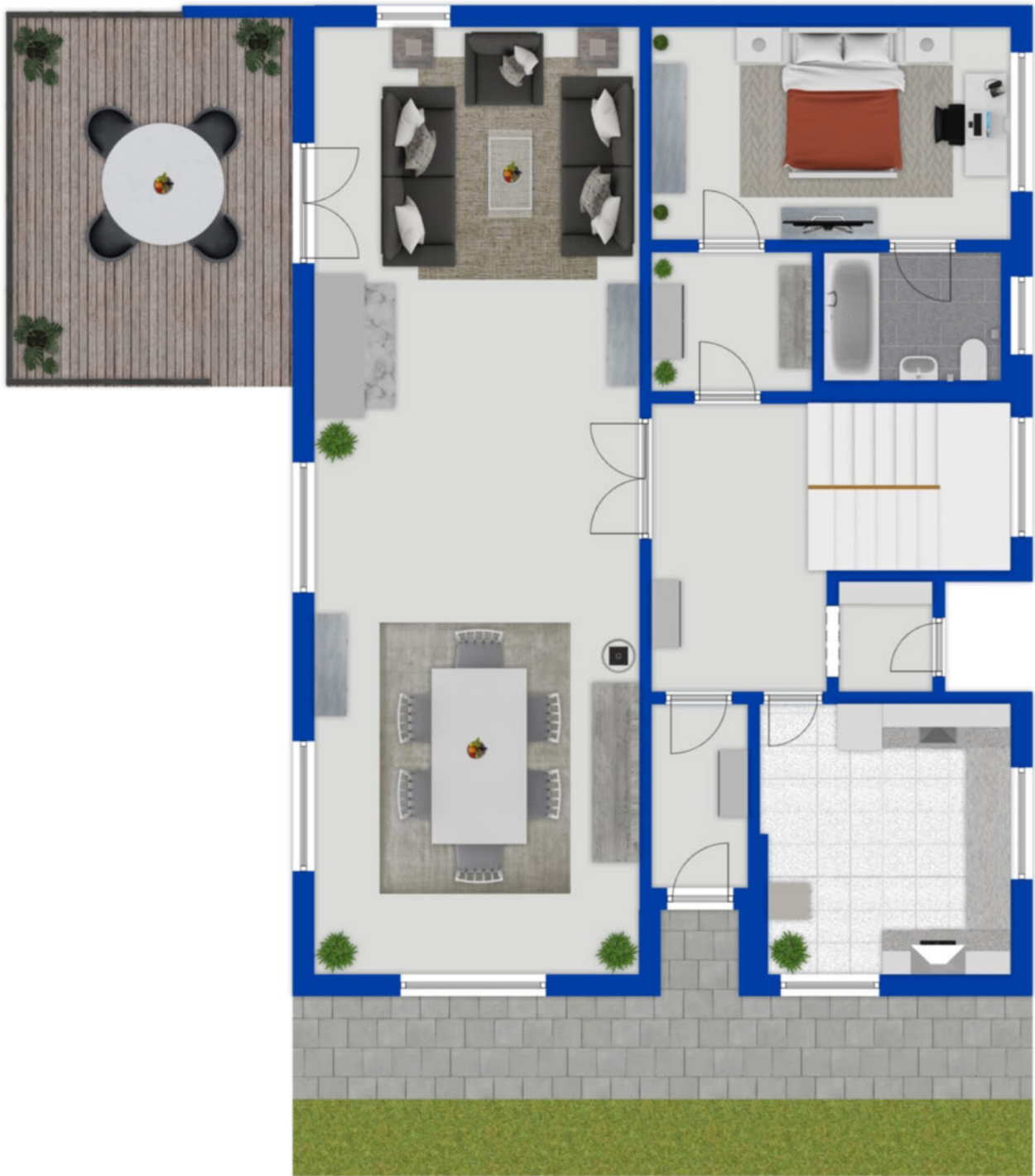
Erdgeschoss als schematische Darstellung