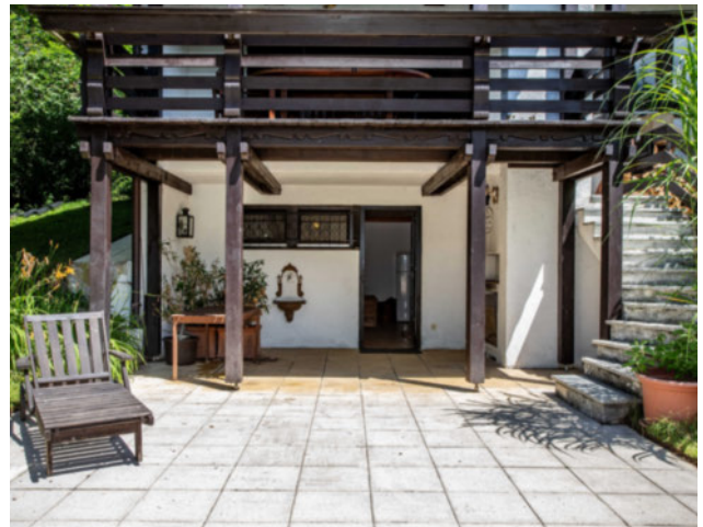
Zugang zur Terrasse