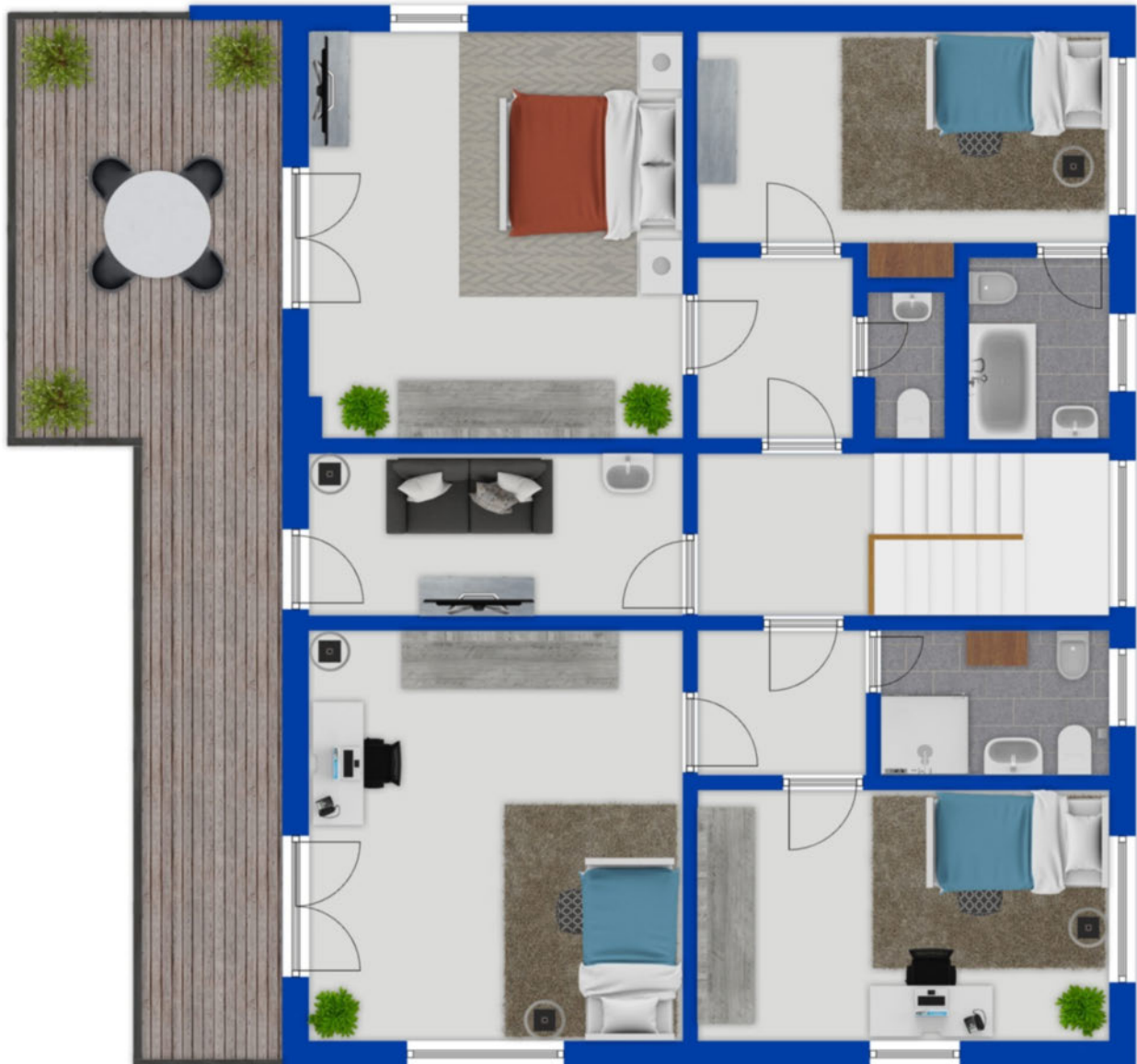
Obergeschoss als schematische Darstellung