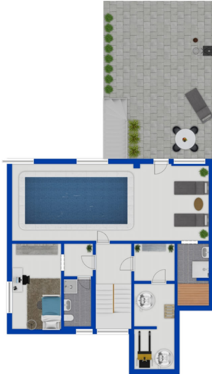
Untergeschoss als schematische Darstellung