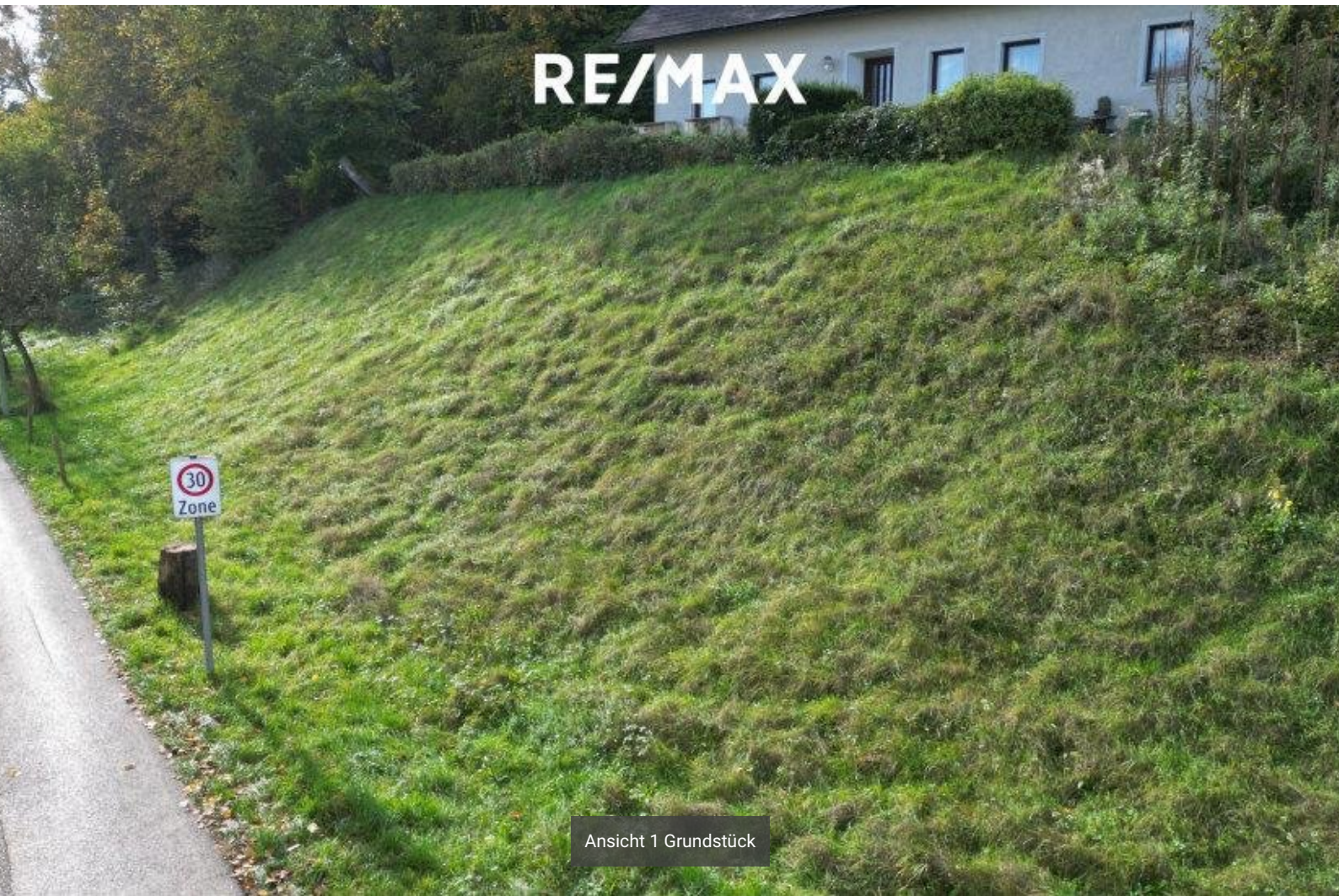
Ansicht 1 Grundstück