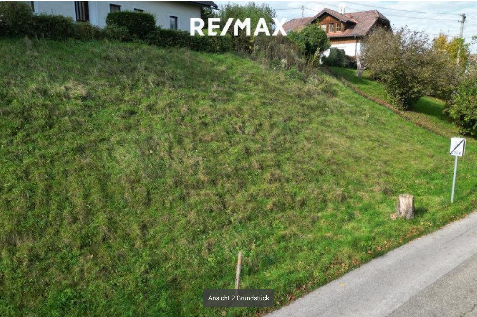
Ansicht 2 Grundstück