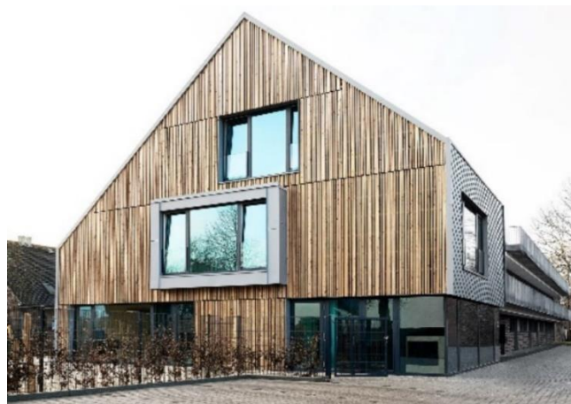
Holzfassade Ost / West

Die Fassadenkonstruktion an der Ost- und Westfassade wird als vorgehängte Holzfassade mit einer Lärchenstreuschalung realisiert. Leibungsverblechungen aus beschichtetem Aluminiumblech gemäß architektonischem Konzept.