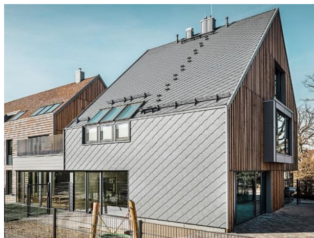
Fassade Straße und Dach Straße

Dach- und Fassadenverblechungen an der Straßenseite werden aus beschichteten Aluminiumblechen ausgeführt im Blechformat Raute. Die Straßenseite wird im Dachbereich nahtlos weitergeführt. Im Bereich der Gartenseite wird eine Dacheindeckung mittels beschichtetem Aluminiumblechs als Falzdeckung umgesetzt.