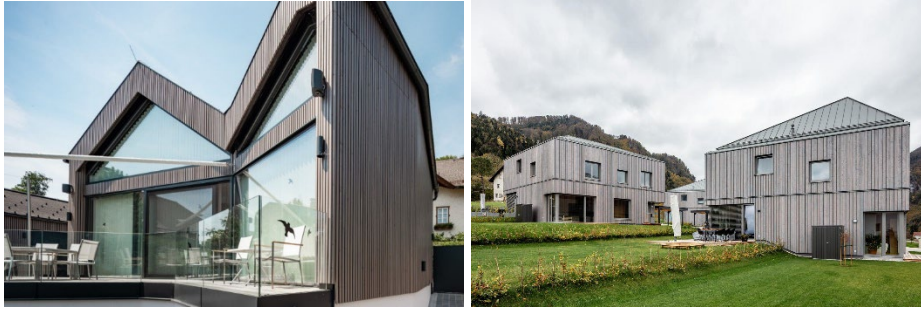
Holzfassade hinterlüftet grau

Die Fassade wird als lasierte, hinterlüftete Holzfassade (zB. Danske odgl., Farbe grau bzw. nach architektonischen Farbkonzept) ausgeführt, wobei im Deckenbereich umlaufende, ca. 40cm breite „Gurte“ eine horizontale Gliederung bewirken.