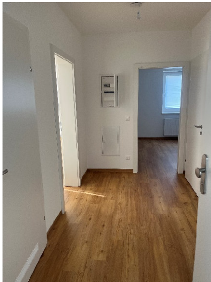
Vorraum – ca. 7,62 m 2