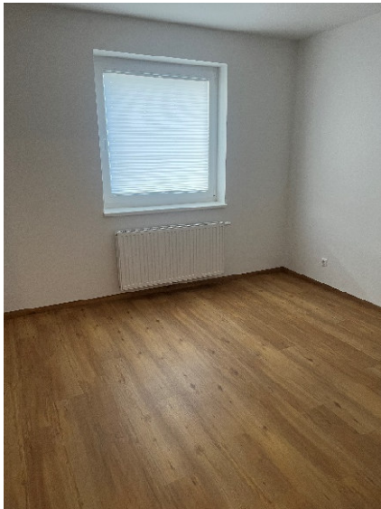
Schlafzimmer – ca. 14,79 m 2