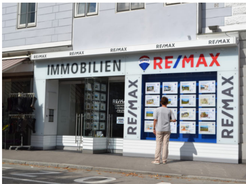
RE/MAX Bad Ischl | Esplanade 4