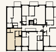
Lage im Stockwerk