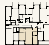
Lage im Stockwerk