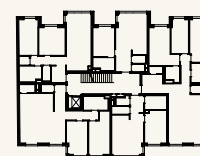
Lage im Stockwerk