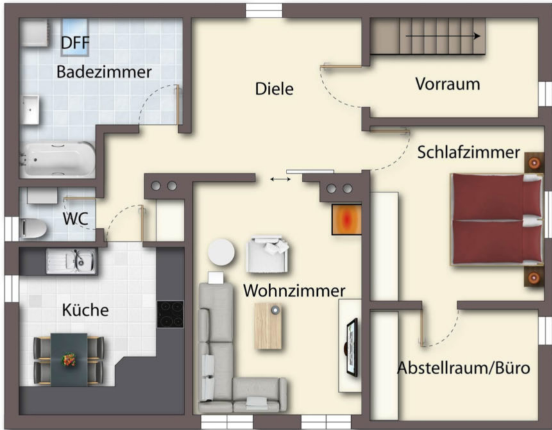
Grundriss OG als schematische Darstellung