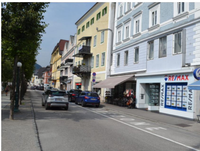
RE/MAX Bad Ischl | Esplanade 4