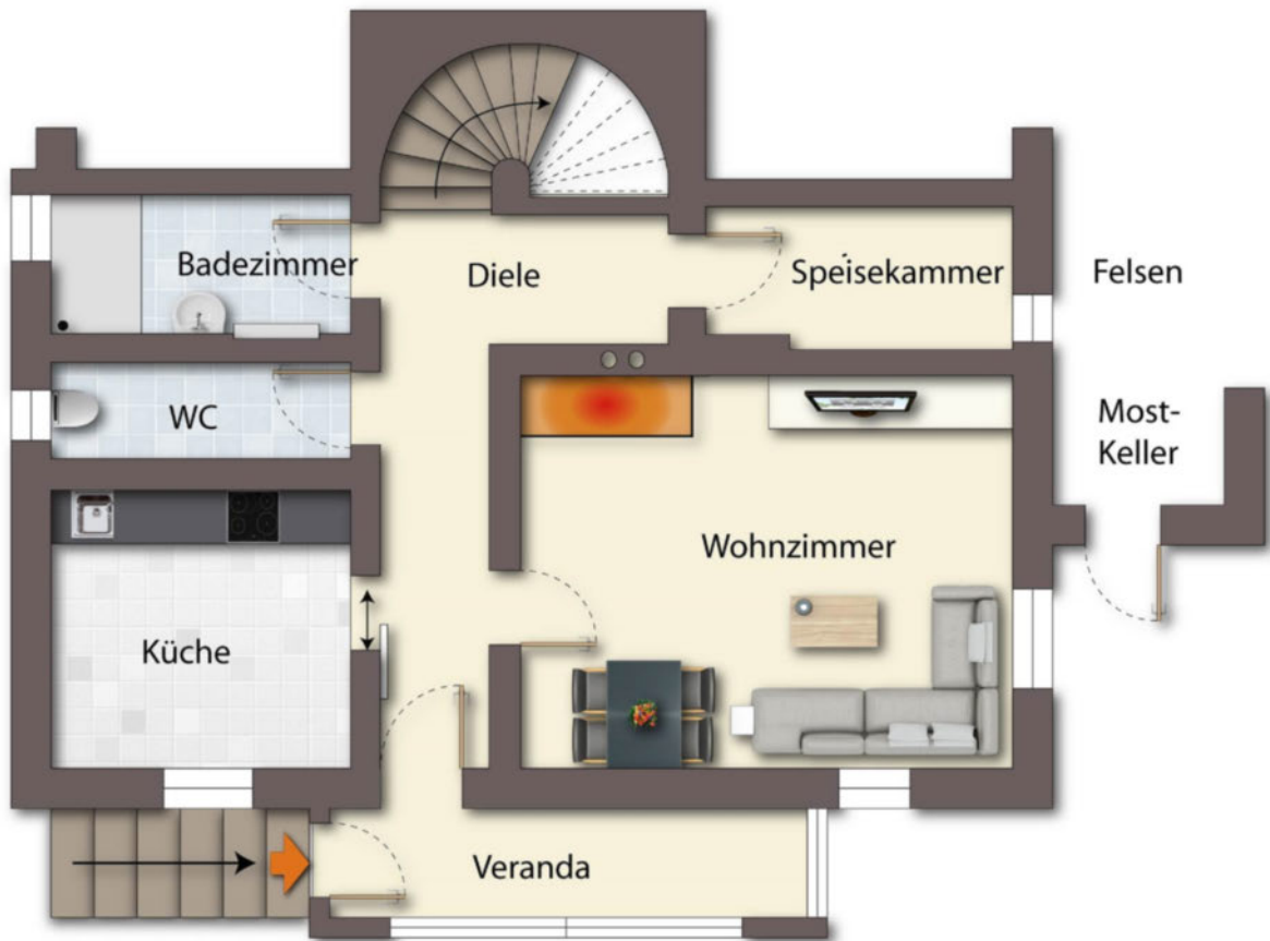
Grundriss EG als schematische Darstellung