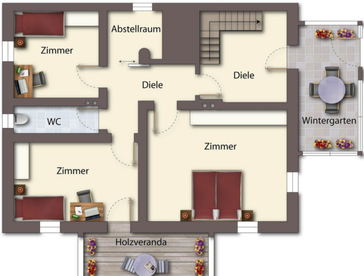
Grundriss DG als schematische Darstellung