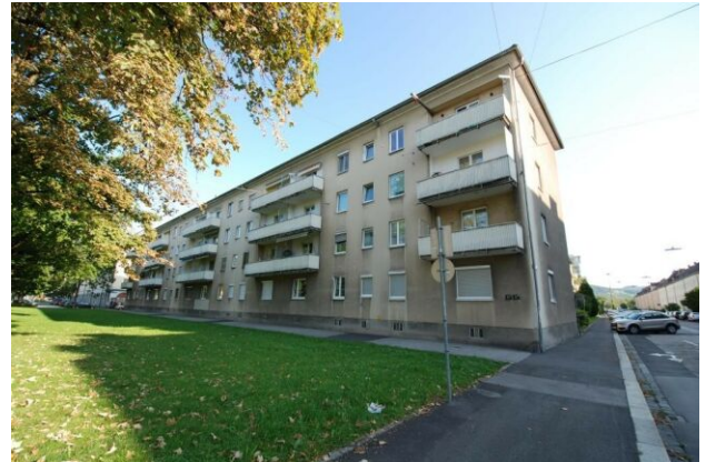
WAG Eigentumswohnung in Urfahr