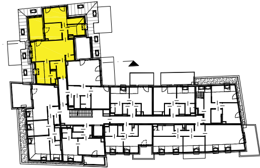
FUß- UND RADWEG