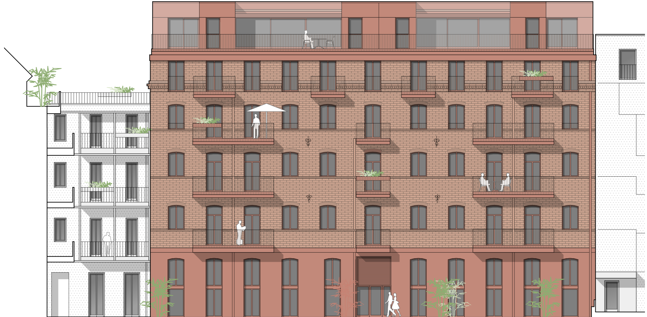
Stiege 3 Ansicht