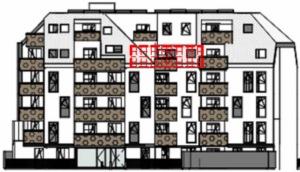
ANSICHT SÜD GARTEN SCHROTTENSTEINGASSE 6