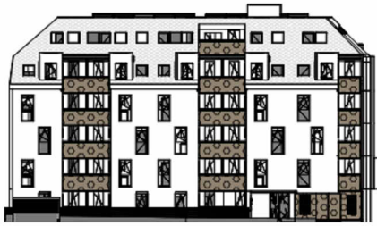
ANSICHT NORD STRASSE SCHROTTENSTEINGASSE 6