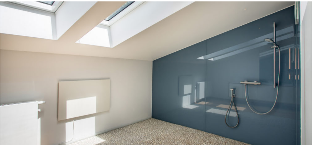
Badezimmer mit Dachfenstern