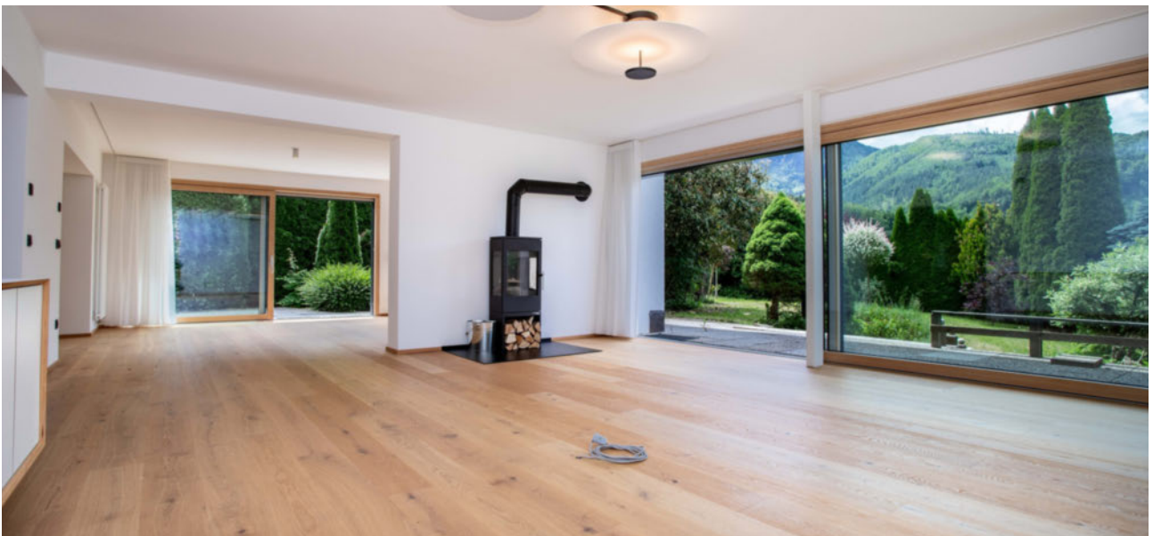
Großer heller Wohnbereich mit Schwedenofen