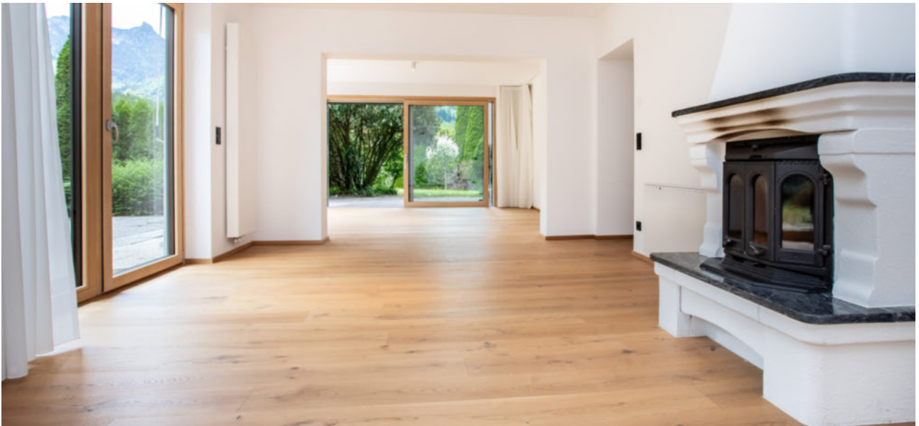
Großer heller Wohnbereich mit Ofen