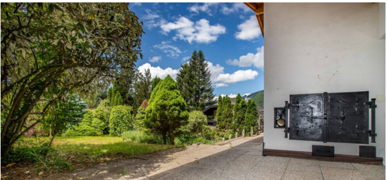
Terrasse mit Außenkamin