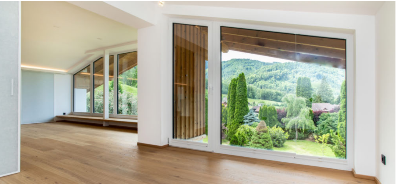
Schlafzimmer und Ausblick