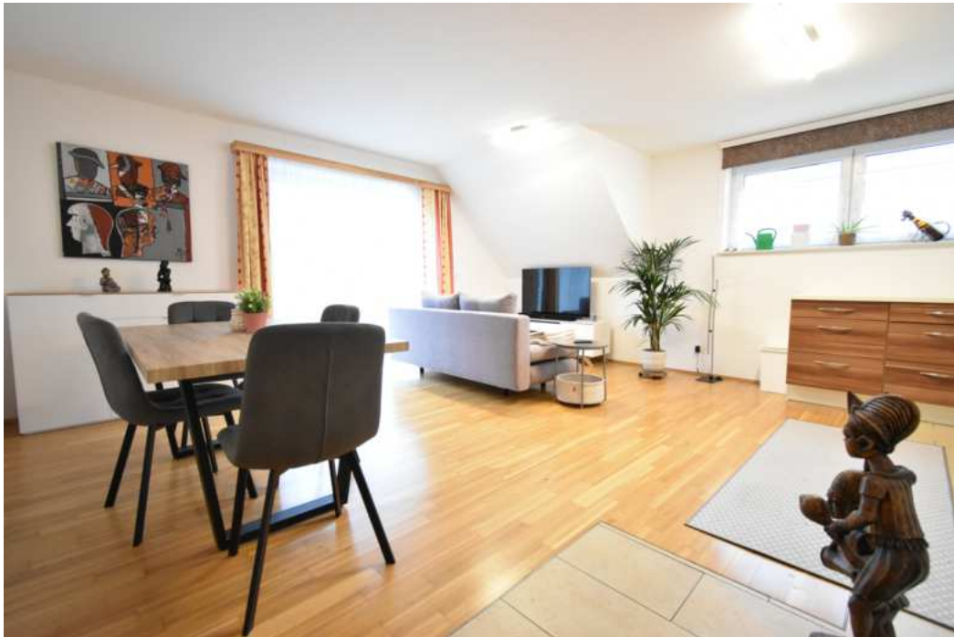
Wohn- und Essbereich mit Ausgang zum Balkon