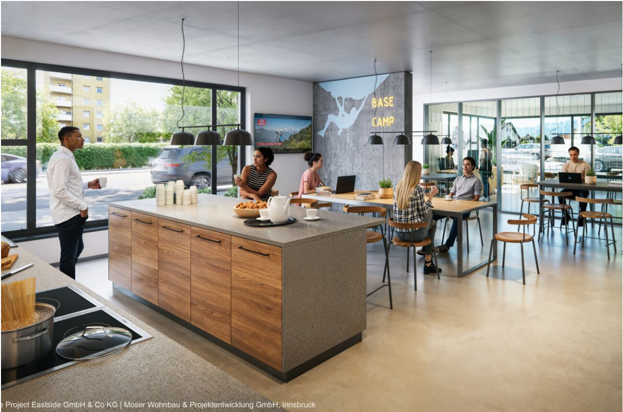
Project Eastside GmbH & Co KG | Moser Wohnbau & Projektentwicklung GmbH, Innsbruck