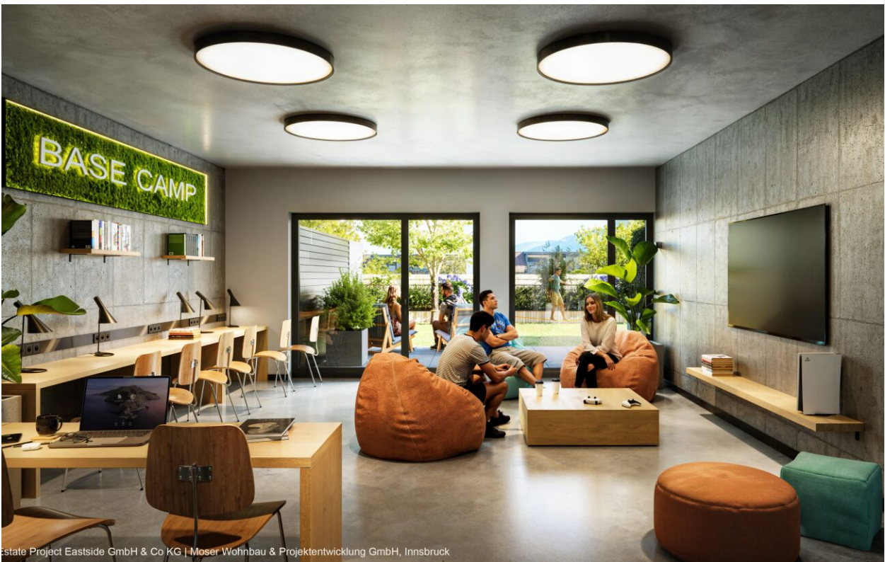
estate Project Eastside GmbH & Co KG | Moser Wohnbau & Projektentwicklung GmbH, Innsbruck