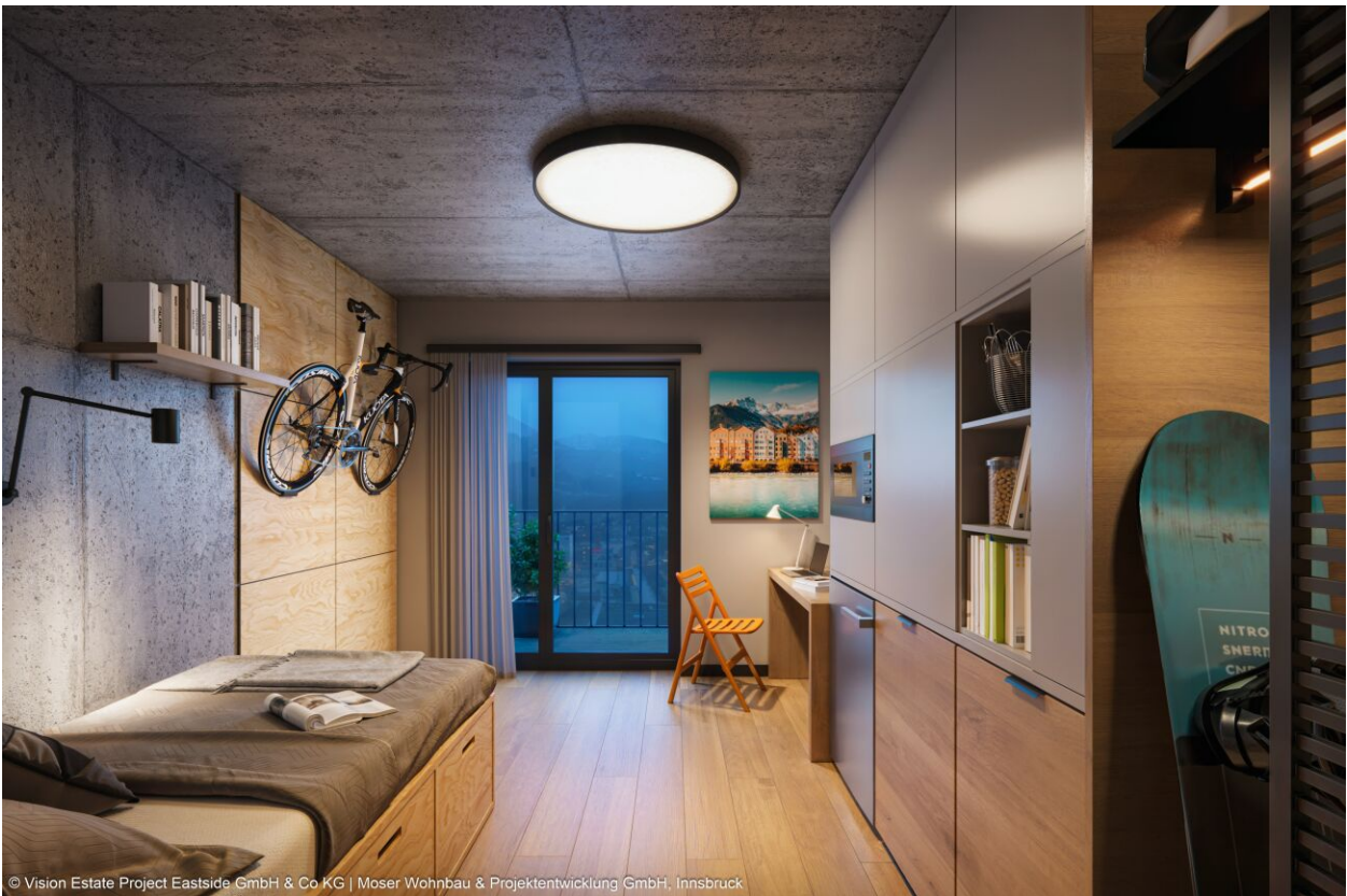
© Vision Estate Project Eastside GmbH & Co KG | Moser Wohnbau & Projektentwicklung GmbH, Innsbruck