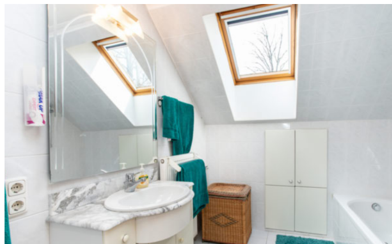
Eines der beiden Badezimmer