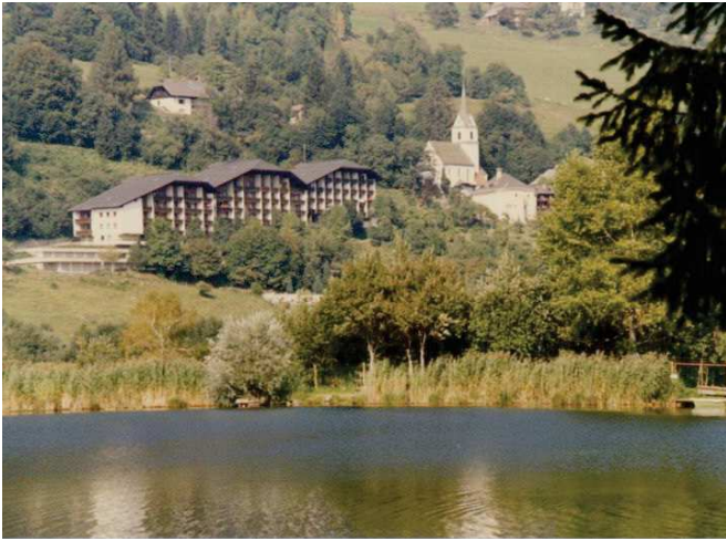
Hausansicht vom See