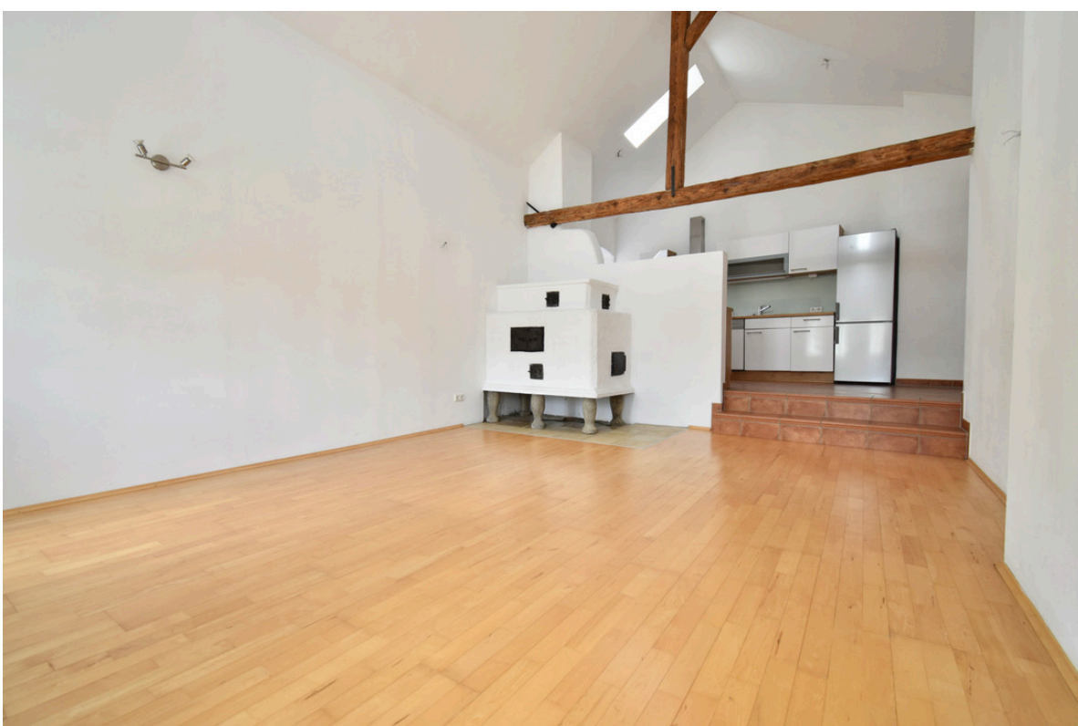
Wohn- und Essbereich mit Blick zur Küche